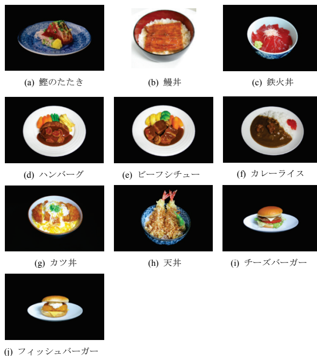
Fig. 1: Ten food categories in the dataset.