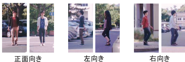
(a) スマートフォンを持たず前方を向いた状態