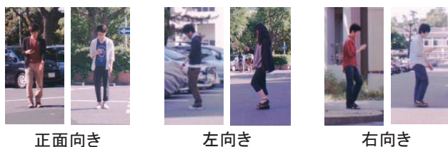
(b) スマートフォンを持ち下方を向いた状態