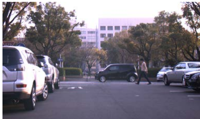
図 1: 運転者から見た「スマホ歩き」歩行者の例

人物の体の向きに加えて、顔向きを認識する研究が報告されている。Flohr らは歩行者を追跡することで得られた情報や方向ごとの顔検出器を用いて顔や体の向きを推定し、さらに顔向きと体の向きの相関を利用することで高精度に認識する手法 [6]